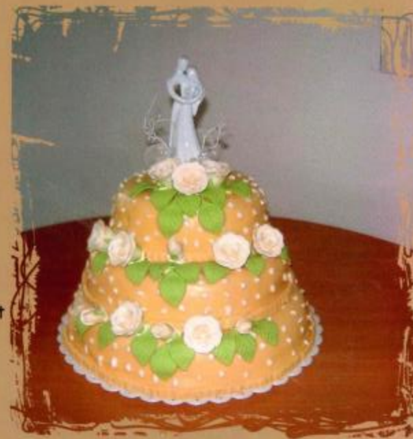
12. Aufsatztorte mit Überzug, Rosen mit Blättern und Brautpaar 2- stöckig 3- stöckig