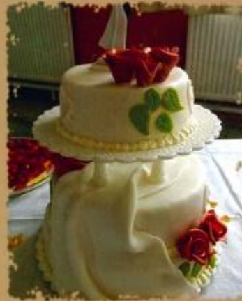
21. Zweistöckige Torte mit kleinen Rosenbouquets und Schleier