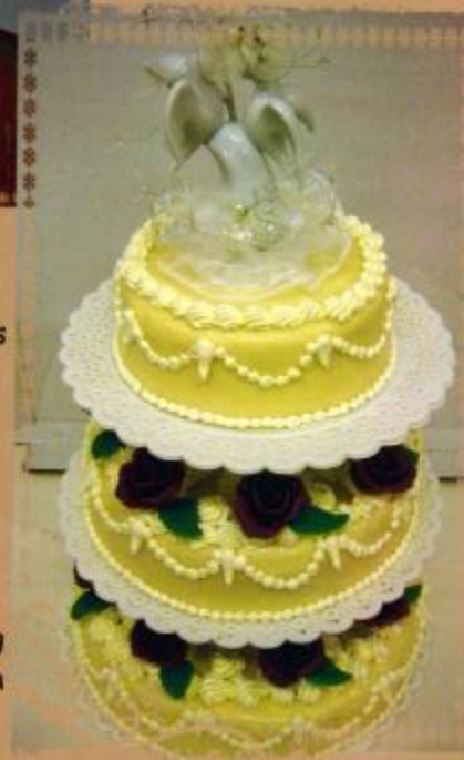
20. Mehrstöckige Torte mit Überzug Rosen mit Blättern und Brautpaar