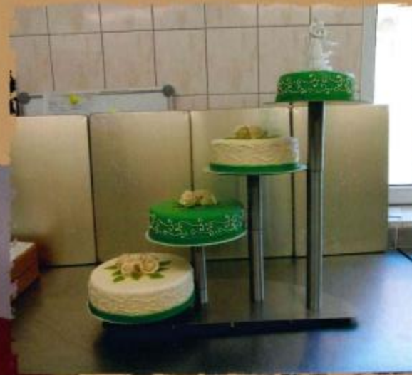
17. Mehrstöckige Torte mit eingefärbtem Zuckerüberzug, eingefärbter Zuckerüberzug als Rand, Rosen mit Blättern und Brautpaar