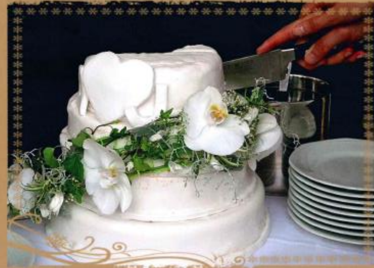
22. 3- stöckige Torte mit weißem Zuckerüberzug und Orchideen