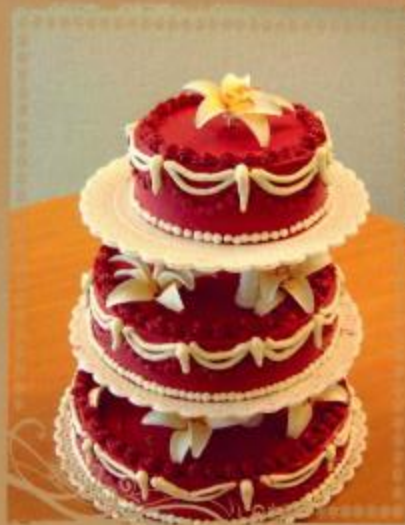
18. Sahne- oder Butterkremtorte mit Lilien 3- stöckig