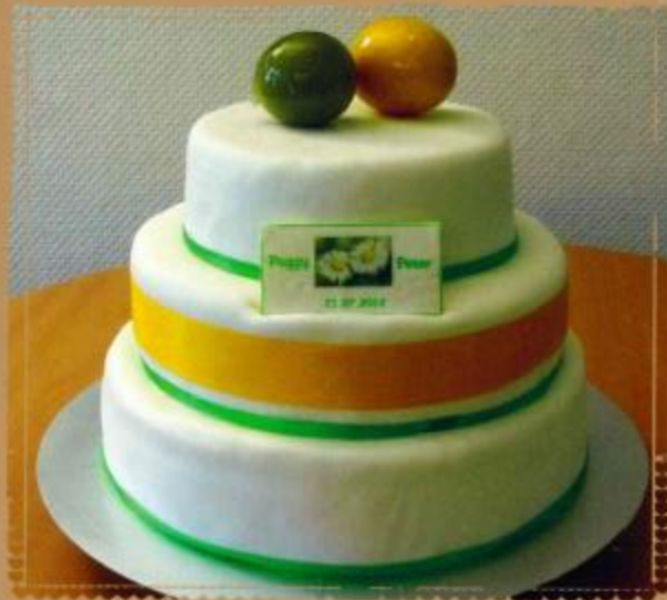
11. Aufsatztorte mit Überzug, farbiges Schleifenband und Fotodruck 2- stöckig 3- stöckig