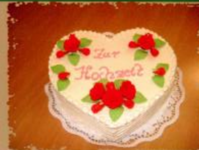
27. Herztorte mit 26 cm Durchmesser mit Rosen mit Blättern und Schriftzug