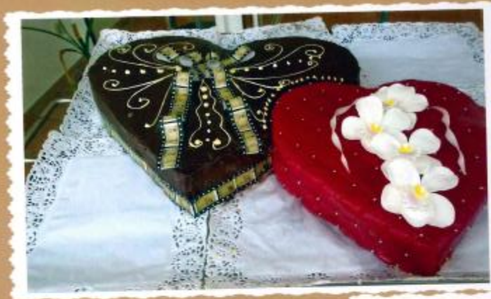
6. Doppelherz mit Zuckerüberzug, Dia Film als Fotodruck und Zucker Orchideen 80x60