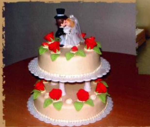
16. Mehrstöckige Torte mit Überzug, Rosen mit Blättern und Brautpaar 2- stöckig 3- stöckig 4 stöckig