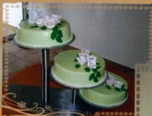
19. Torte mit Zuckerüberzug weißen Rosen als rankendes Bouquet und Brautpaar 3- stöckig