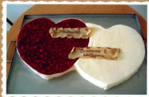
8. Doppelherz eine Seite mit frischen Erdbeeren belegt, andere Seite als Sahne- oder Butterkremtorte mit Zuckerüberzug, abgeflämtes Marzipanschriftband 80x60