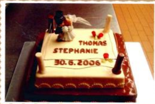
9. Zweistöckige Aufsatztorte als Boxring mit Überzug, Brautpaar und Schriftzug.