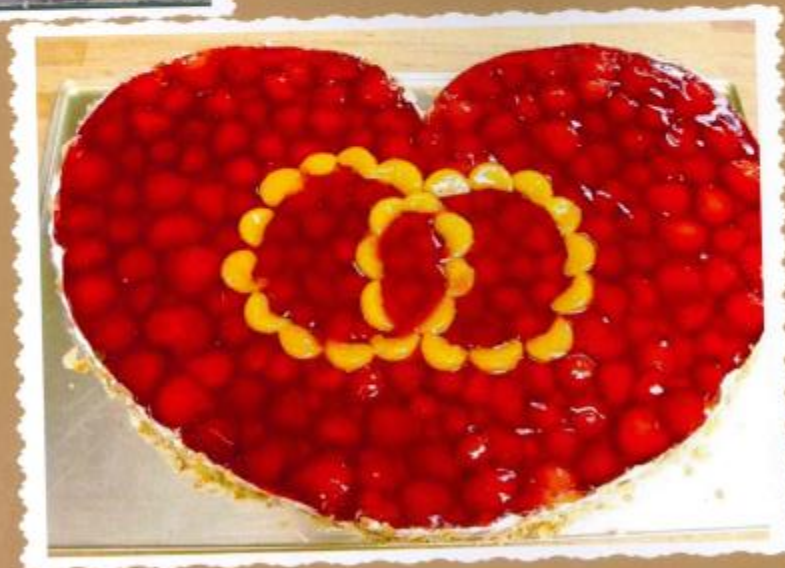
7. Erdbeerherz mit frischen Erdbeeren belegt, mit Mandarinen als Ringe und Mandelrand 60x40 80x60