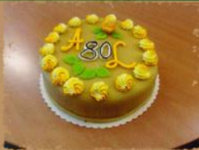
25. Torte mit 26 cm Durchmesser mit Marzipanüberzug, Rosen mit Blättern und Schriftzug