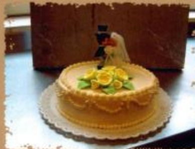
26. Torte mit 26 cm Durchmesser, kleine Rosenbouquets und Brautpaar