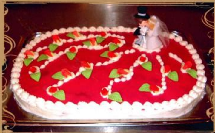
28. Rechteckige Torte mit Geleespiegel, Rosen und Brautpaar 30x40 60x40